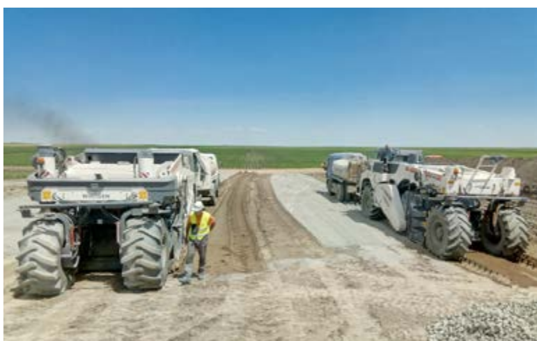
замешавање тла и хидрауличног везива