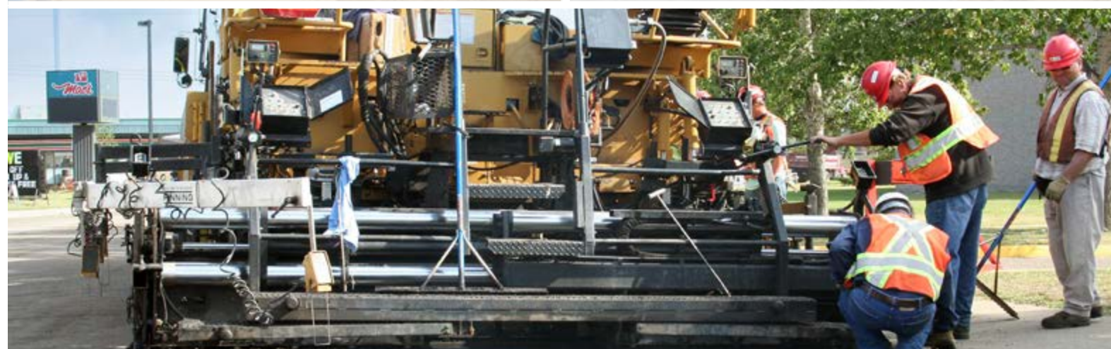
израда хабајућег слоја